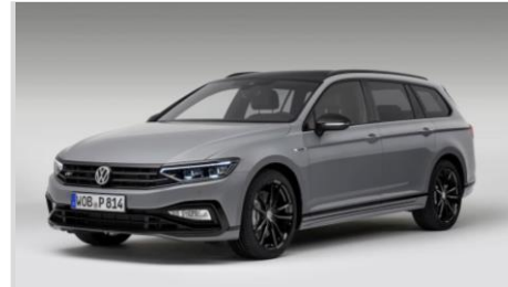
VW PASSAT GT 2,0 TDI DSG