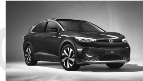
VW ID.4 Pro Performance