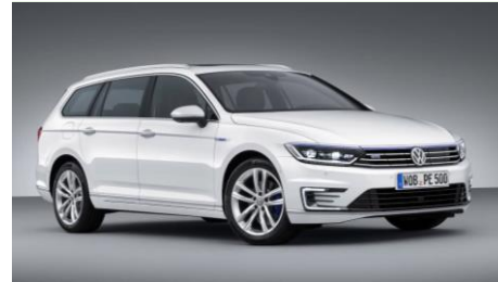
VW PASSAT GTE 1,4 TSI DSG